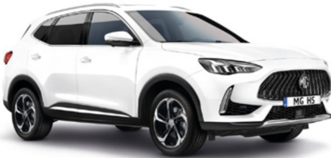
DOVER WHITE- бела