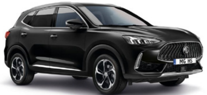
PEBBLE - црна