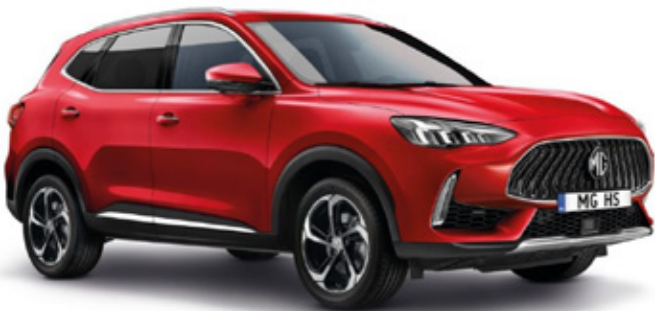
DIAMOND – црвена (COMFORT)