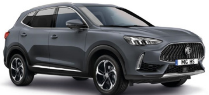
MAGIC – темно сива